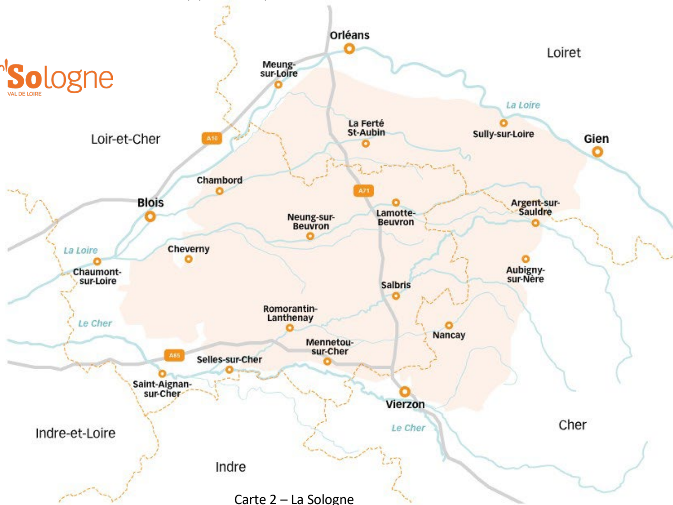
Carte 2 – La Sologne